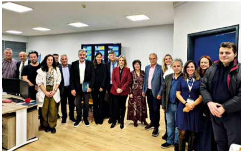
Στιγμιότυπα του Εργαστηρίου Στρατηγικής του Ελ.Δ.Α.Π. - Adaptation Hub Greece, Νοέμβρης 2025

Στη συνάντηση εργασίας που πραγματοποιήθηκε στην έδρα του Ελ.Δ.Α.Π., συμμετείχαν δήμαρχοι και