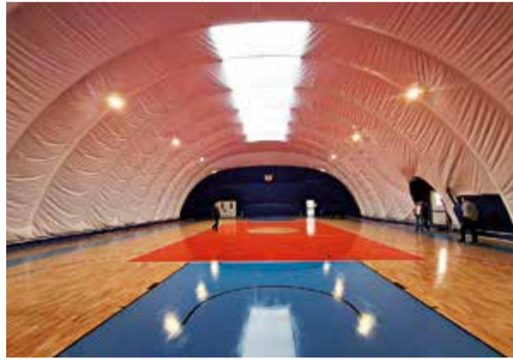
Γήπεδο διπλής χρήσης

Οπότε το προπονητήριο έρχεται να ικανοποιήσει αυτές τις ανάγκες» ανέφερε αρχικά ο Γ. Κουτελάκης.