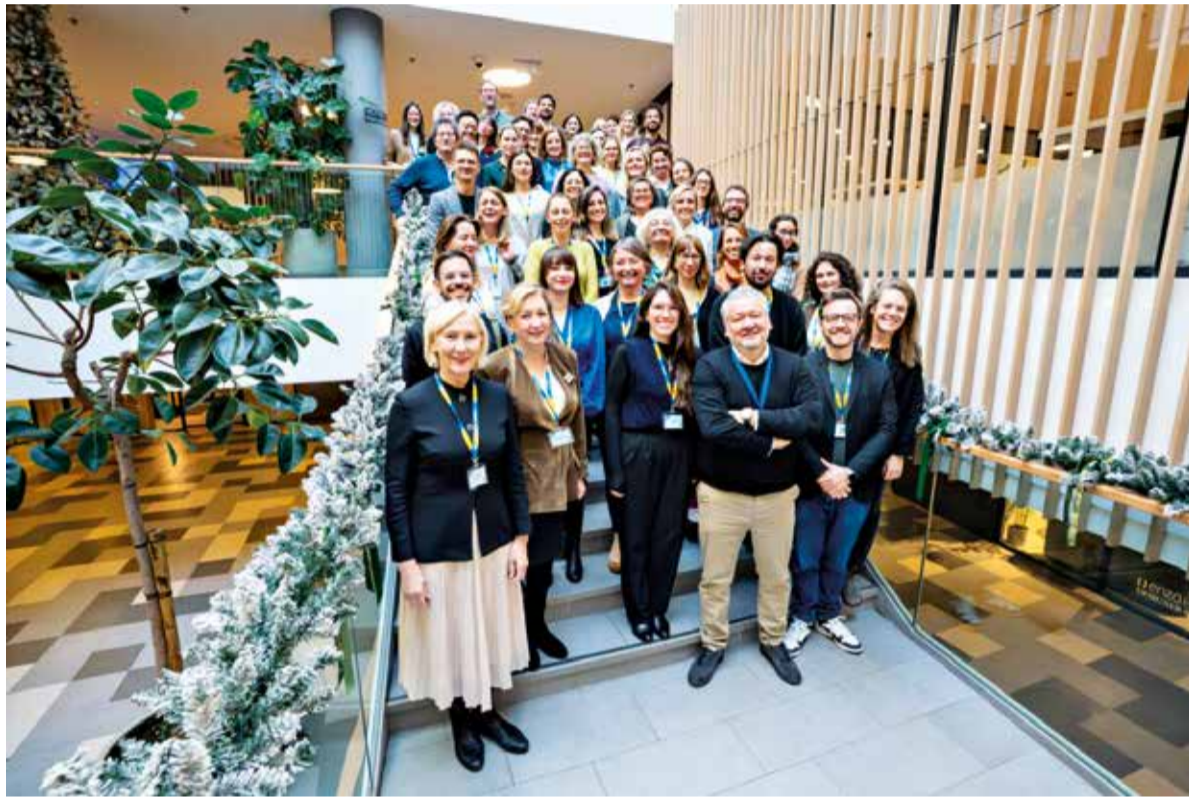
Εναρκτήρια συνάντηση του έργου Adaptation Hubs και των 27 Εθνικών Κόμβων, στο Ζάγκρεμπ της Κροατίας, Δεκέμβρης 2025

Ειδικότερα, οι δραστηριότητες του Κόμβου περιλαμβάνουν συζητήσεις, εργαστήρια, εκπαιδευτικές δράσεις και πρωτοβουλίες ευαισθητοποίησης, στοχεύοντας στη διάχυση καλών πρακτικών, ευκαιριών, σύγχρονων εργαλείων αξιολόγησης κινδύνων καθώς και στον σχεδιασμό στρατηγικών προσαρμογής. Παράλληλα, επιδιώκεται η ανάπτυξη και εφαρμο-