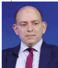
Γράφει ο ΑΙΜΙΛΙΟΣ ΠΕΡΔΙΚΑΡΗΣ