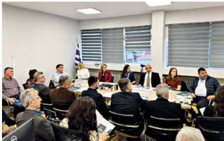
Στιγμιότυπα του Εργαστηρίου Στρατηγικής του Ελ.Δ.Α.Π. - Adaptation Hub Greece, Νοέμβρης 2025

εκπρόσωποι Δήμων - μελών του, επιβεβαιώνοντας τη σημασία μιας συμμετοχικής προσέγγισης (bottom-up) στον σχεδιασμό. Πρόκειται για μια διαδικασία που λαμβάνει υπόψη τόσο τις ανάγκες των μελών όσο και τους ευρύτερους παράγοντες που