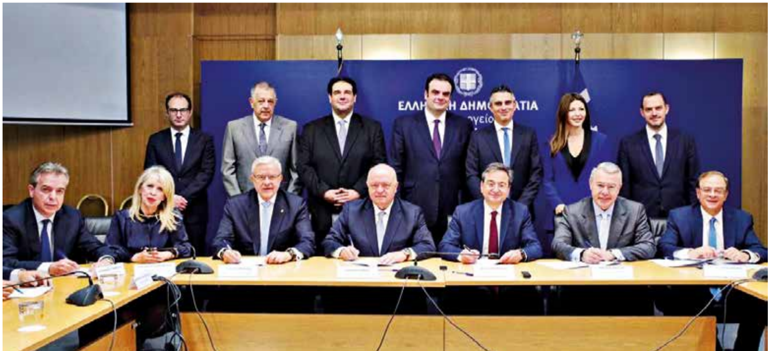
Έπασαν οι υπογραφές για την υλοποίηση της Β' Φάσης του προγράμματος «Μαριέττα Γιαννάκου» σε συνολικά 238 σχολικές εγκαταστάσεις και 132 Δήμους της χώρας

Σε όλα τα σχολεία θα γίνουν εκτεταμένες παρεμβάσεις, ανάλογα με τις ανάγκες που υπάρχουν, όπως: