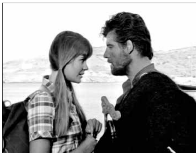
Ανν Λόνμπεργκ - Γιάννης Βόγλης από την ταινία «Κορίτσια στον Ήλιο» (Ανδρός 1968)

Η πολυβραβευμένη ταινία του Βασίλη Γεωργιάδη, ύμνος στο ελληνικό καλοκαίρι, με τον Γιάννη Βόγλη και την Ανν Λόνμπεργκ, που στιγμάτισε μια ολόκληρη νέα γενιά!